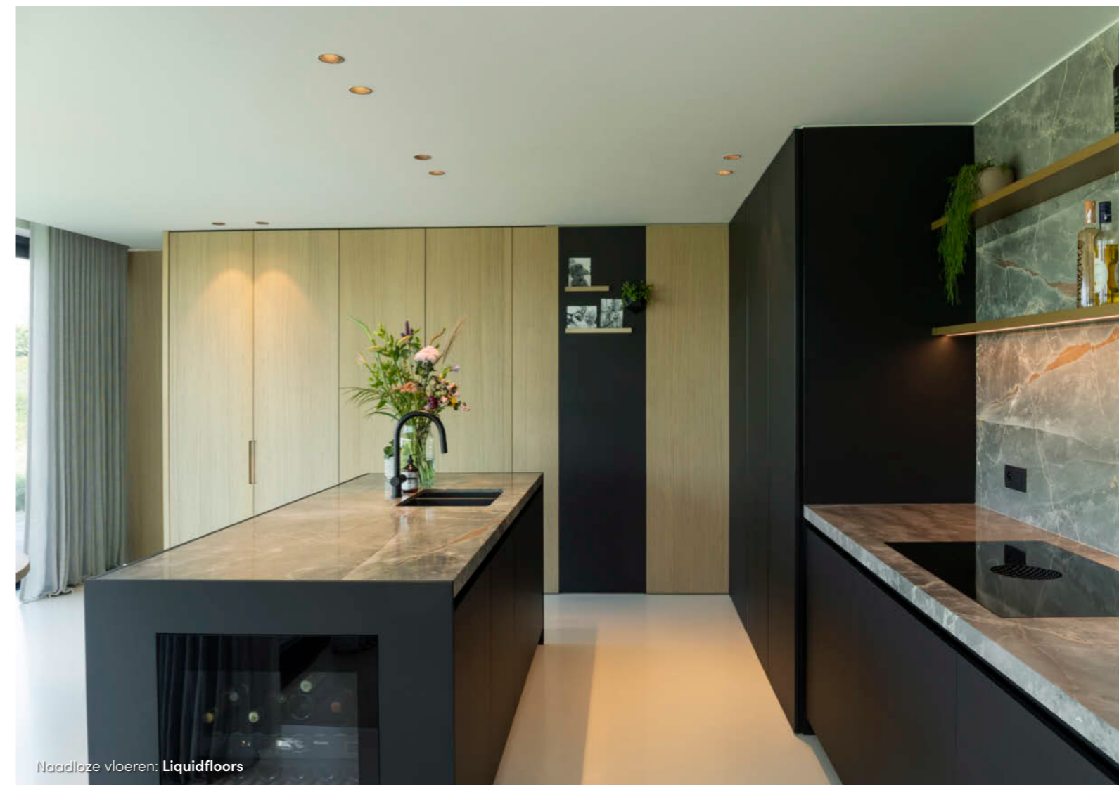
Naadloze vloeren: Liquidfloors

wielermiddens en steevast wordt opgenomen in het parcours van de Ronde van Vlaanderen. Dat de wielersport hier volop leeft, wordt bewezen door het feit dat de weg en de kasseien geklasseerd zijn als Erfgoed. Naar achter toe loopt het terrein sterk op, waardoor een deel van de woning zich ondergronds bevindt.